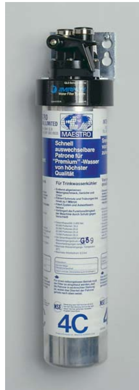
QC4 actief kool smaakfilter